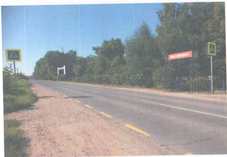
Фото на странице: 3